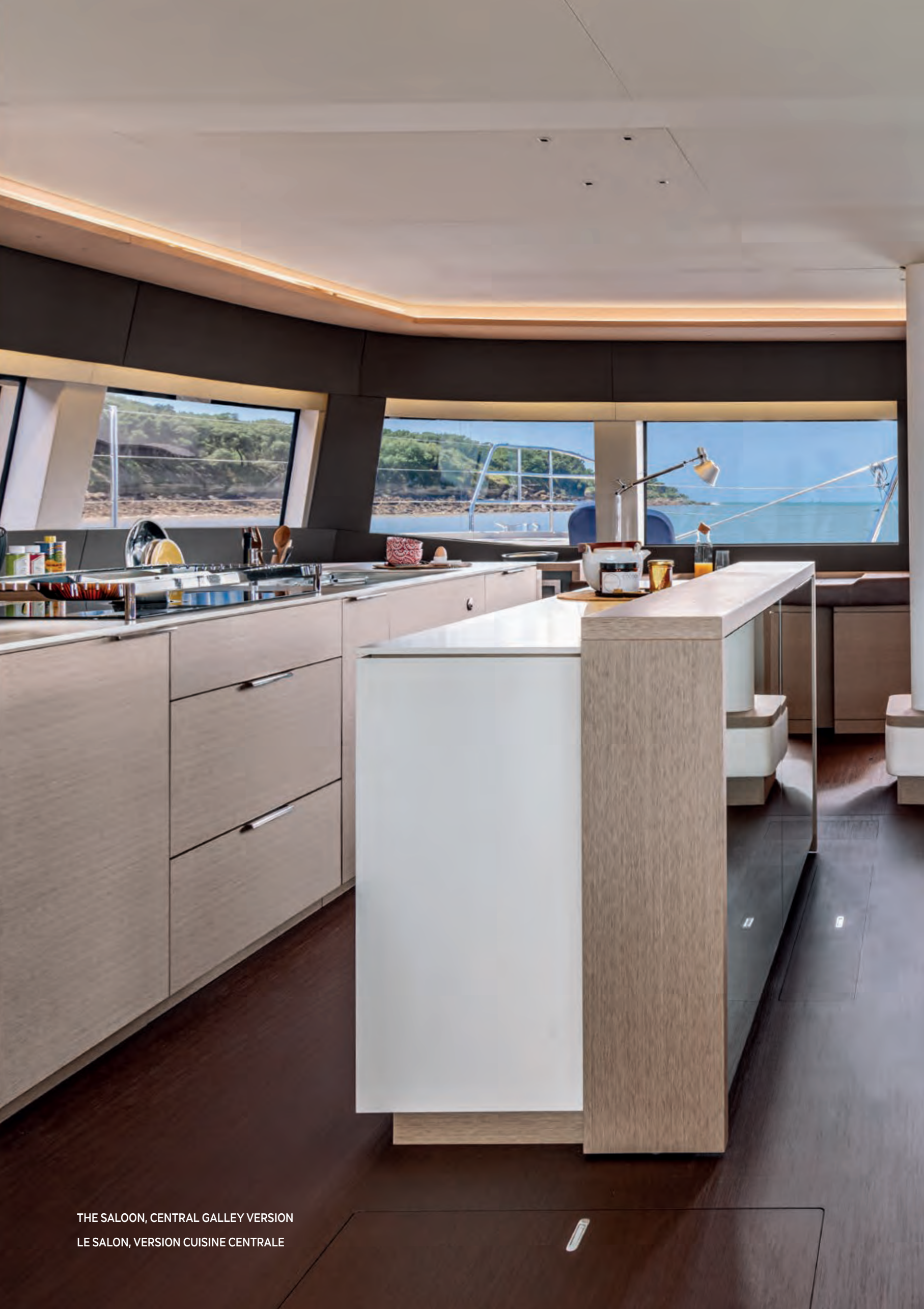
THE SALOON, CENTRAL GALLEY VERSION LE SALON, VERSION CUISINE CENTRALE