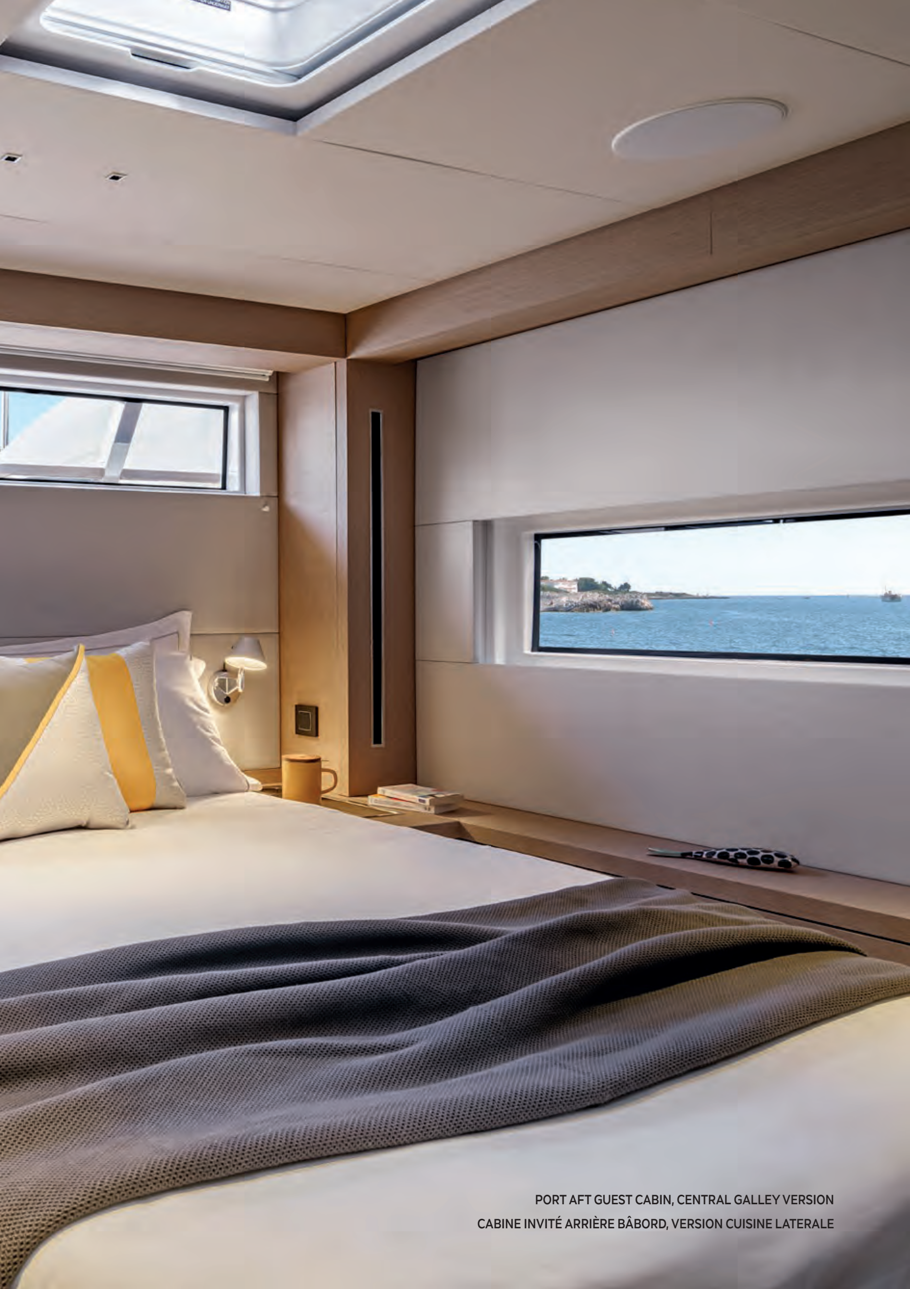
PORT AFT GUEST CABIN, CENTRAL GALLEY VERSION CABINE INVITÉ ARRIÈRE BÂBORD, VERSION CUISINE LATÉRALE