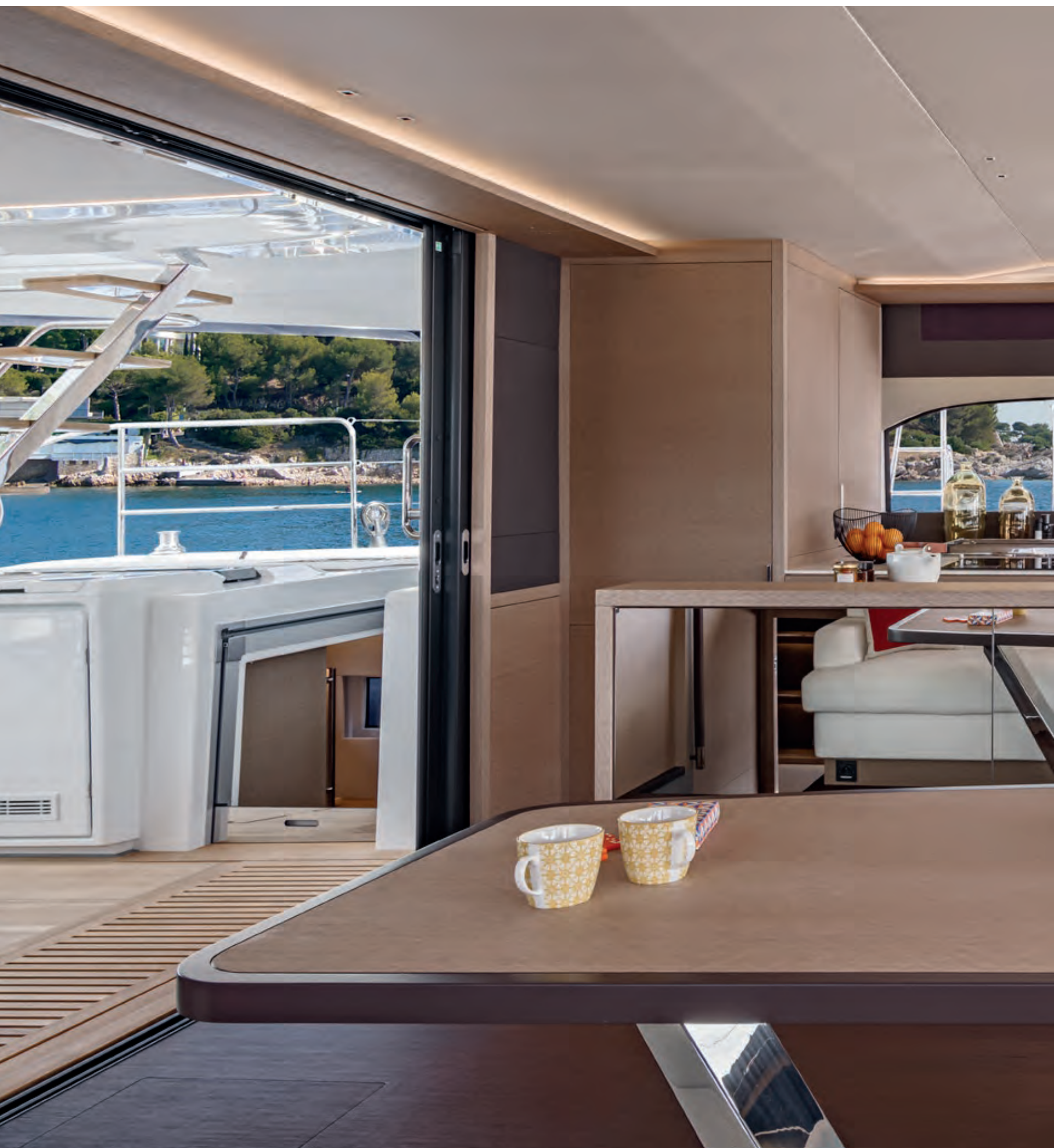
THE SALOON, CENTRAL GALLEY VERSION