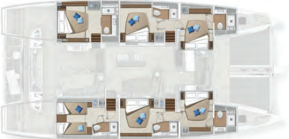
6 cabins - 6 cabines