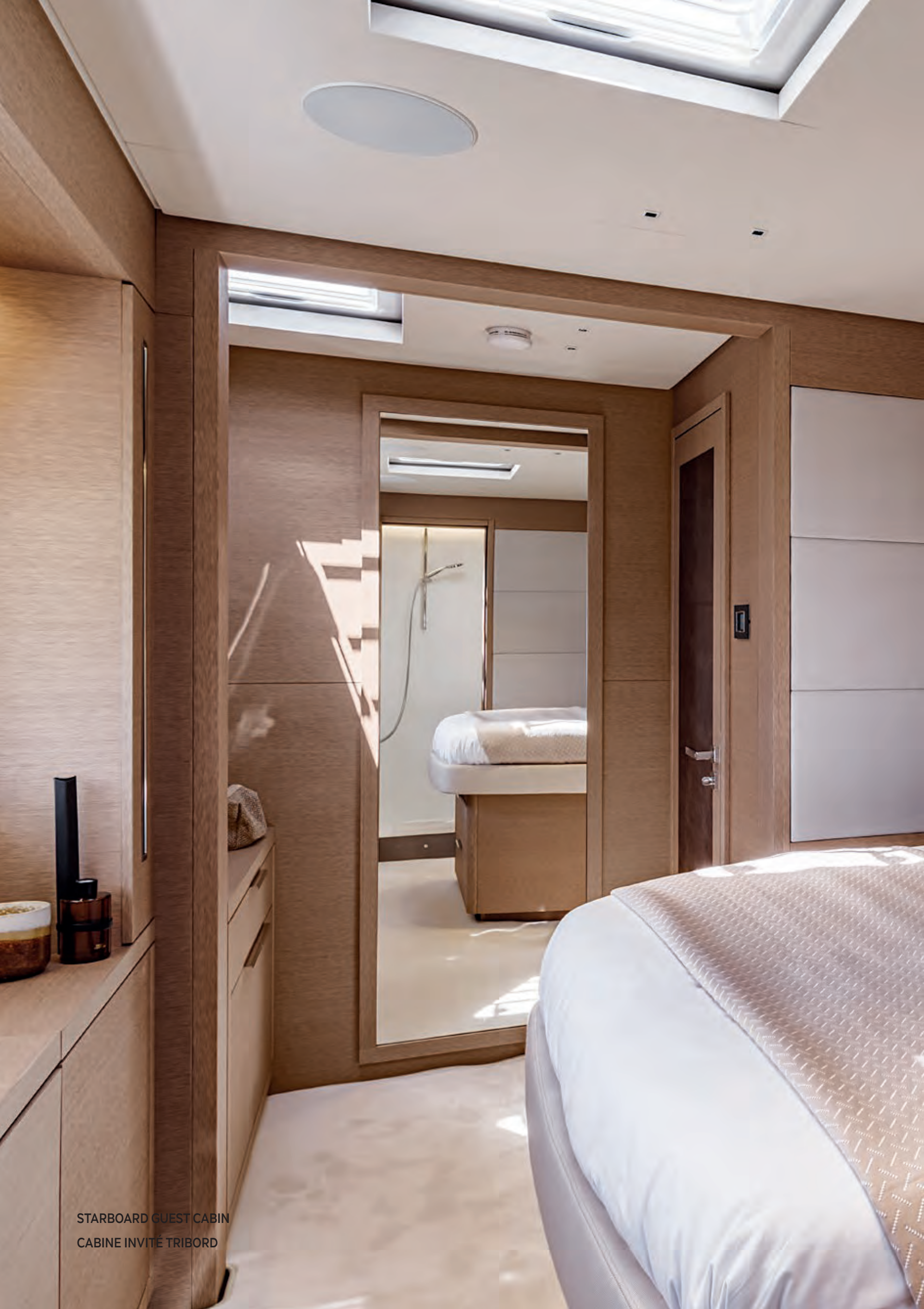
STARBOARD GUEST CABIN CABINE INVITÉ TRIBORD