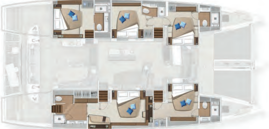
5 cabins - 5 cabines