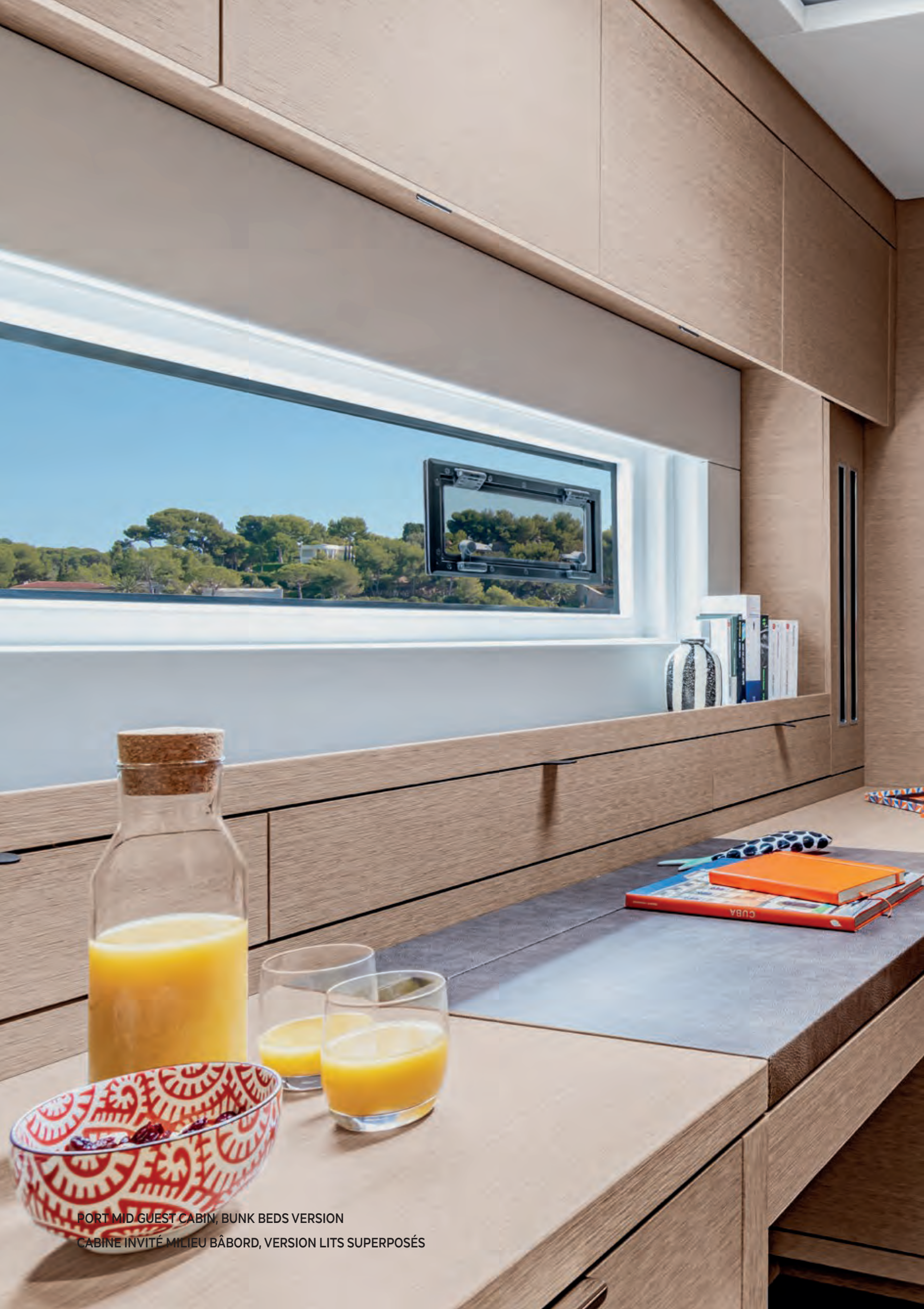
PORT MID GUEST CABIN, BUNK BEDS VERSION CABINE INVITÉ MILIEU BÂBORD, VERSION LITS SUPERPOSÉS