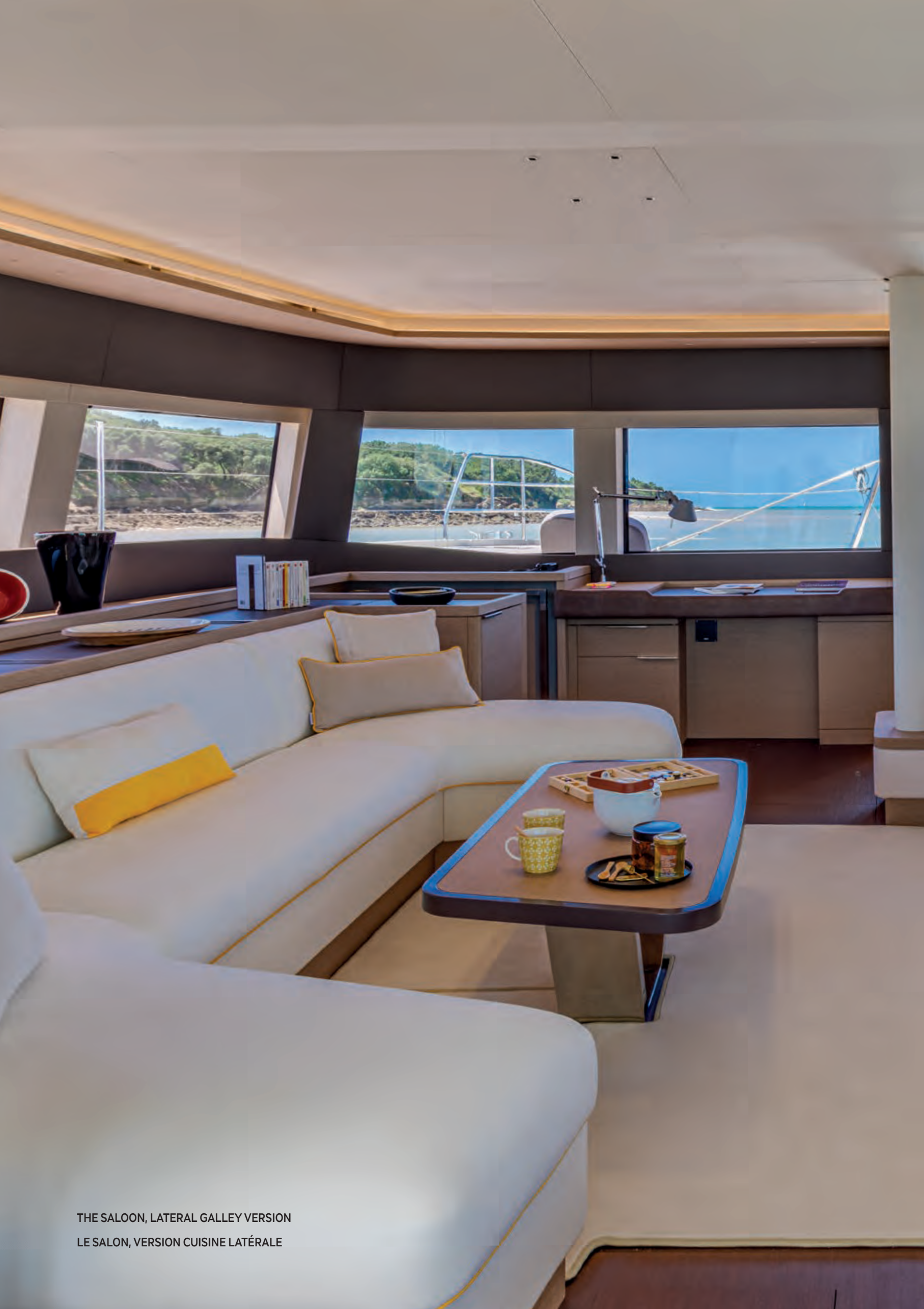
THE SALOON, LATERAL GALLEY VERSION LE SALON, VERSION CUISINE LATÉRALE