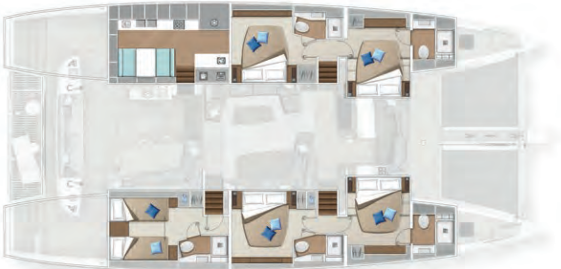
5 cabins - 5 cabines